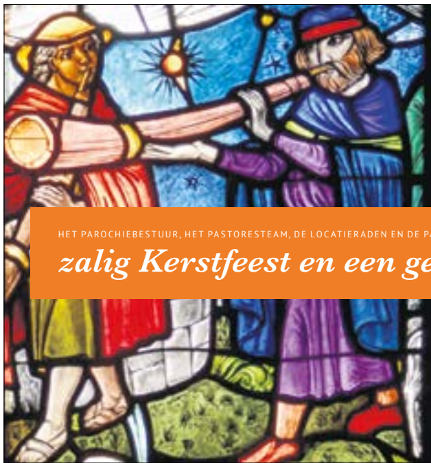
Foto: raamwerk de Heilige Nicolaas in Drenth (Gert Schreiner, 1989)

Wij hopen u ook volgend jaar weer in een van onze kerken te mogen ontmoeten.