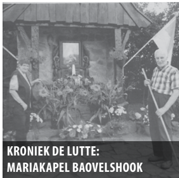
KRONIEK DE LUTTE: MARIAKAPEL BAOVELSHOOK