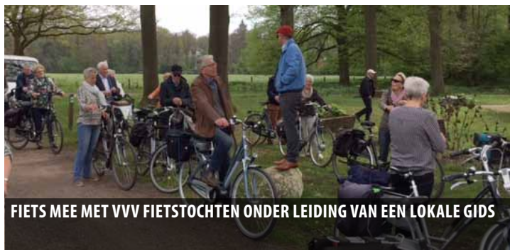
FIETS MEE MET VVV FIETSTOCHTEN ONDER LEIDING VAN EEN LOKALE GIDS

Uitgave 11 - van 31 juli t/m 21 augustus 2018