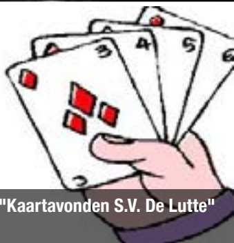
"Kaartavonden S.V. De Lutte"

Uitgave 12 - van 3 September t/m 24 September 2014