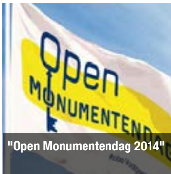
"Open Monumentendag 2014"