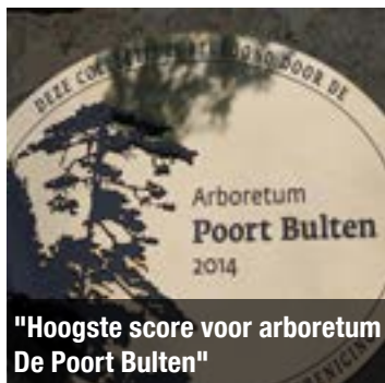
"Hoogste score voor arboretum De Poort Bulten"