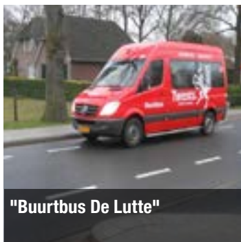
"Buurtbus De Lutte"