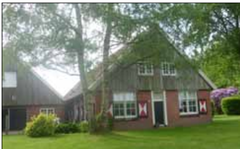
De Elzahoeve / de Boet

Kortom, er was uitgebreide bewaking rondom dit gebied en voor het vervoer van de munitie werden door de Duitse