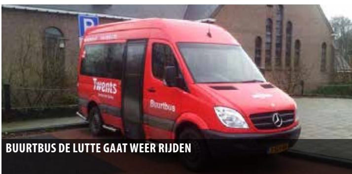
BUURTBUS DE LUTTE GAAT WEER RIJDEN