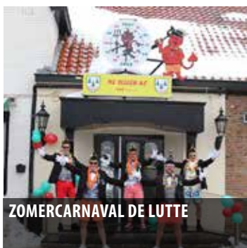
ZOMERCARNAVAL DE LUTTE

Uitgave 12 - van 17 augustus t/m 7 september 2021