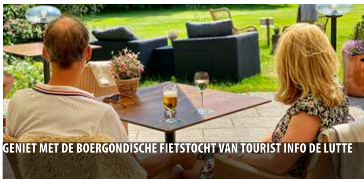
GENIET MET DE BOERGONDISCHE FIETSTOCHT VAN TOURIST INFO DE LUTTE