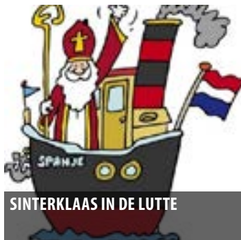
SINTERKLAAS IN DE LUTTE