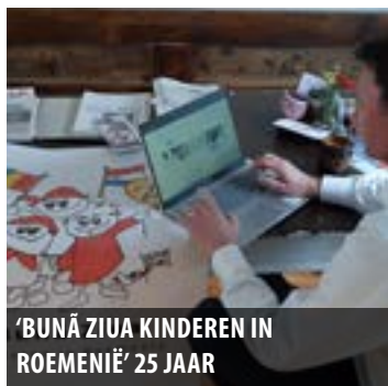
'BUNĂ ZIUA KINDEREN IN ROEMENIË' 25 JAAR

Uitgave 16 - van 9 november t/m 30 november 2021