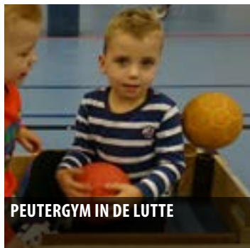
PEUTERGYM IN DE LUTTE