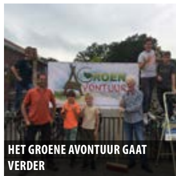
HET GROENE AVONTUUR GAAT VERDER