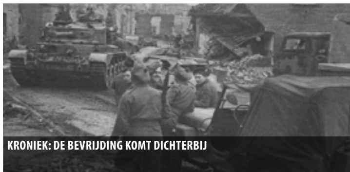
KRONIEK: DE BEVRIJDING KOMT DICHTERBIJ

Uitgave 5 - van 10 maart t/m 31 maart 2020