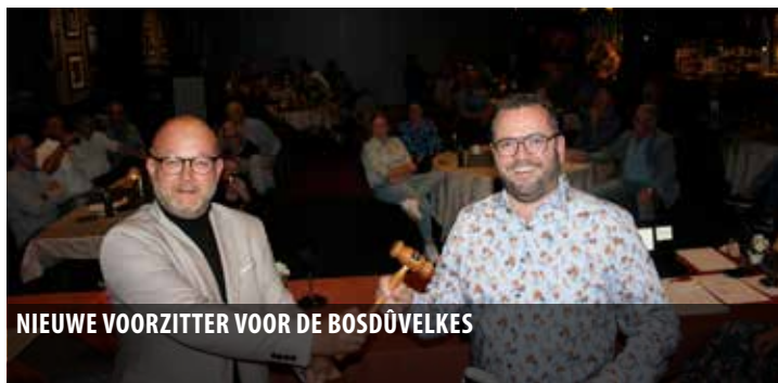
NIEUWE VOORZITTER VOOR DE BOSDÜVELKES