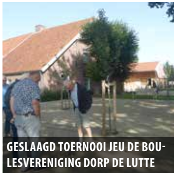
GESLAAGD TOERNOOI JEU DE BOU- LESVERENIGING DORP DE LUTTE